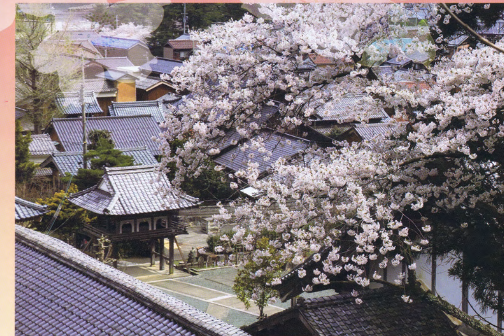
瑞林寺(早瀬)