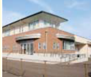
4 美浜町給食センター