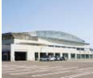
5 美浜町総合体育館