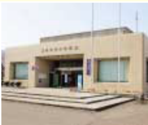
2 美浜町中央公民館