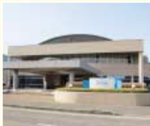
1 美浜町保健福祉センター はあとびあ