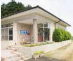
6 美浜町子育て支援センター